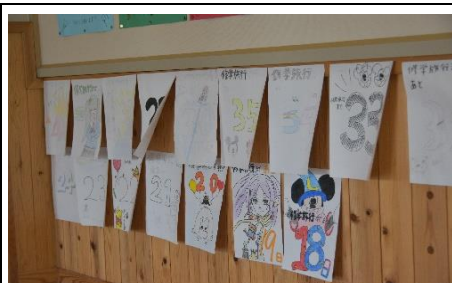
カウントダウンカレンダー