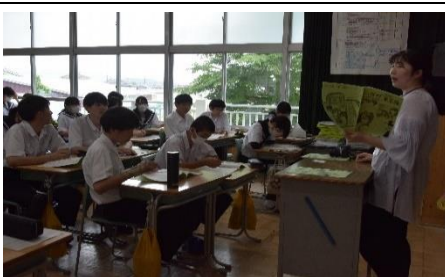
しおりの読み合わせ