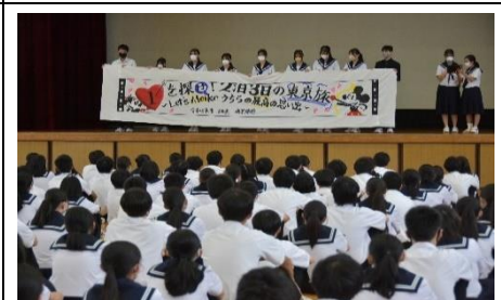
実行委員による学年集会