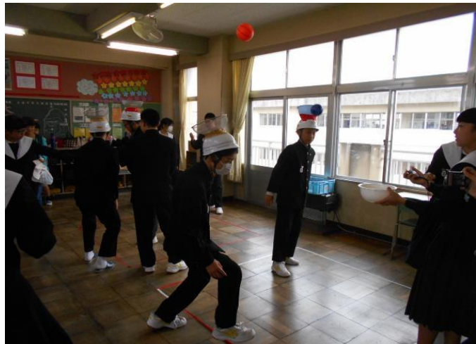
2年2組 アクロバットボールキャッチ ヘルメット上のかごにボールを入れます。