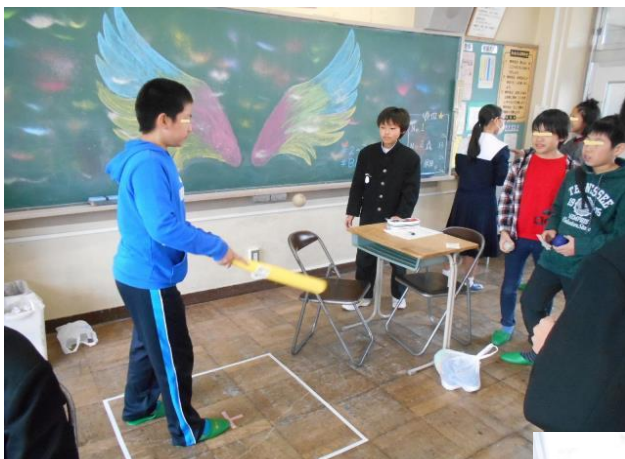
2年3組 BATの星 ボールをバットではじく回数で勝負