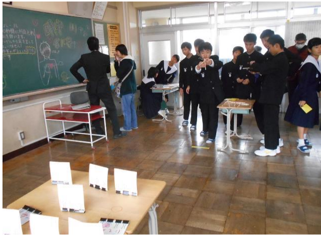
2年1組 明中・的中 君に夢中 30秒で数多くの的に当てます。