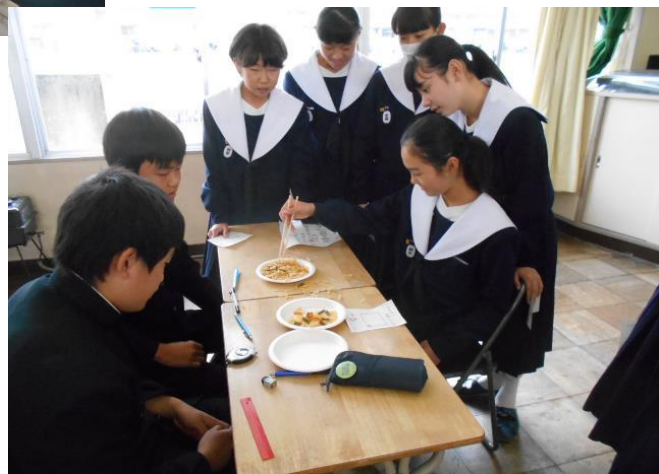
2年4組 マカロニ引越センター はしでマカロニを皿から皿へ移します。