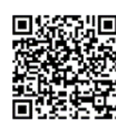
「ラーケーションの日」活動事例集