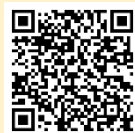
「ラーケーションの日」活動事例集