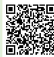
「ラーケーションの日」 活動例