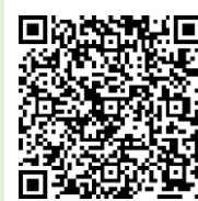
「ラーケーションの日」 ポータルサイト

「ラーケーションの日」には、様々な活 動ができます。どのような活動ができ るのか、どうやって「ラーケーションの日」を取ればよいの かなど、興味をもった人は、おうちの方に配った「保護者 用リーフレット」を見たり、右の二次元コードから、「ラーケ ーションポータルサイト」の「『ラーケーションの日』活動例」 を見たりしながら、おうちの方と話し合ってください。