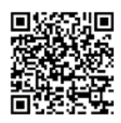
「ラーケーションの日」活動事例集