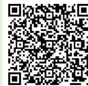
「ラーケーションの日」ポータルサイト

「ラーケーションの日」には、様々な活動ができます。どのような活動ができるのか、どうやって「ラーケーションの日」を取ればよいのかなど、興味をもった人は、おうちの方に配った「保護者用リーフレット」を見たり、右の二次元コードから、「ラーケーションポータルサイト」の「『ラーケーションの日』活動例」を見たりしながら、おうちの方と話し合ってください。