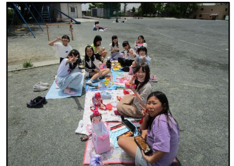
(3組ペア活動 3年生とお弁当)