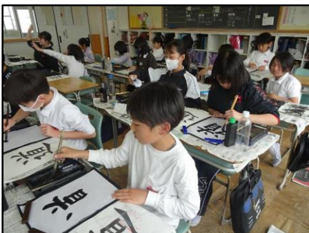
(1組書写 毛筆「道」の練習)