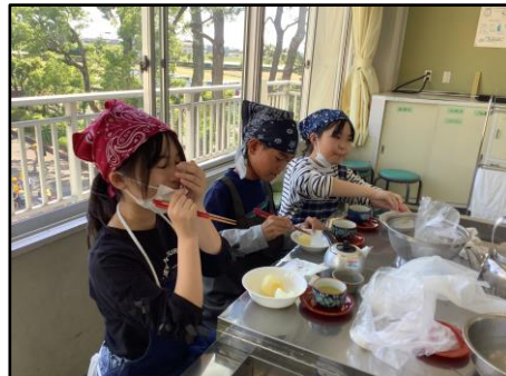
(2組 家庭科 調理実習)