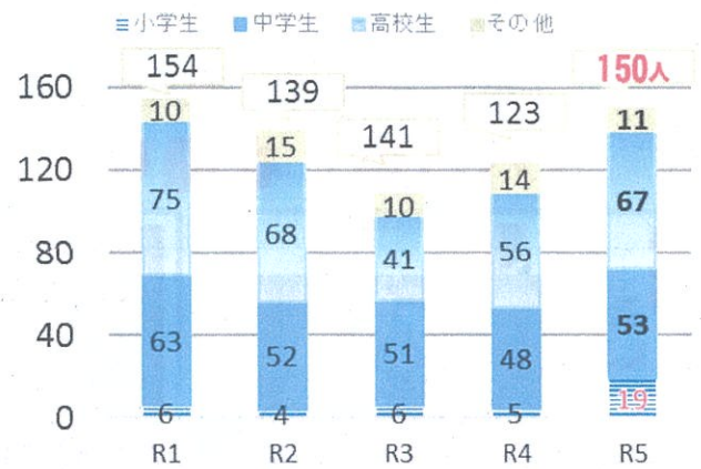
■学職別被害児童数の推移