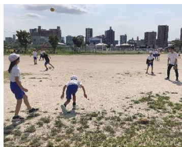
先生とキャッチボール！