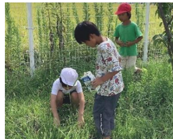
カマキリいないかなあ…

10月7日から、運動会の練習が本格的に始まります。行事を通し、伸びようとする子どもたちの瞬間をとらえ、認め励まし、支えていきたいと思ひます。