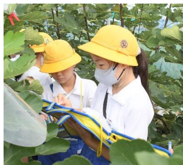
3年 イチジク畑の見学