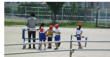
協力してハードルを片付ける3年2組の子

PTA 保健福祉委員会では、11月26日（金）の学用品バザー開催に向けて準備を進めています。会員の皆様には、リユース学用品の提供にご協力をいただき、大変ありがとうございます。皆様のご協力で、徐々にバザー品が増えてきましたが、1学期の個人懇談会の折にも、回収箱を準備します。引き続きご協力をお願いします。