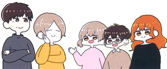
イラスト：愛知工業大学 大学生サイバーボランティア

裏面では、実際にインターネット利用によって子供たちに起きた犯罪やトラブルをご紹介します。